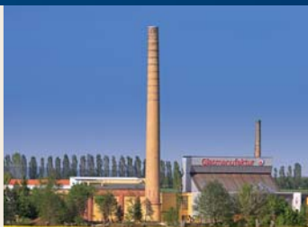
Uitzicht op de glasmanufaktur