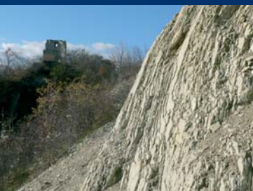
Kalksteengroeven en uitkijktoren Horstberg

Van Wernigerode richting Benzingerode staat links op de Horstberg, de resten van een oude uitkijktoren. Hier boven op de Kammweg ontdekt u dan ook een open steengroeve. De Horstberg heeft twee heuvelruggen: de 'terebratella-laag' van het onderste schelpkalk en het 'trochietenkalk' van de bovenste schelpkalk. De daartussen liggende lagen van het middelste schelpkalk verdwijnen sneller en vormen daarom een dalkom. In het centrale gedeelte van de steengroeve is het vallen van de lagen en de verticale stelling van de 'Nordharz-Aufrichtungszone' zichtbaar. Hier wordt de 'terebratella-laag' van het onderste Schelpkalk afgebouwd. U kijkt dan over het Harzvoorland met het Sub-Hercynische bekken. Aan de zuidelijke berghelling, in de akkergrond, vallen de rood-grijze, deelse blauwe kleuren van het Bundsandstein op.