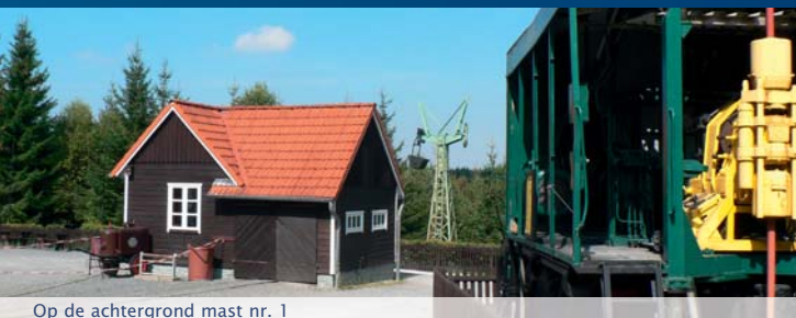
Op de achtergrond mast nr. 1

Vanaf Heimbürg rijdt u richting Elbingerode en volgt de borden naar de bezoekersmijn 'Schaubergwerk Büchenberg'. Vanaf de parkeerplaats wandelt u langs liefdevol gerestaureerde machines naar de ingang. Rolstoelgebruikers kunnen met de auto naar de ingang rijden. Hier valt meteen een ijzeren mast in het oog. Het is mast nr. 1 van de ooit langste industriële kabelbaan in Europa. In de bezoekersmijn zelf is sinds 1989 een 600 m lang gedeelte van de 1 ste schachtbodem tussen de kabelbaan en schacht 1 (Rotenbergschacht) voor publiek geopend. De groeve geeft een indruk over de techniek en winning van ijzererts in de laatste fase van de mijn. Ook voor rolstoelgebruikers is deelname aan een rondleiding mogelijk. Interessante steentypen en lagen zijn in de geologische ontsluiting te ontdekken. De geluiden van o.a. de boorhamer, de overkoplader en de