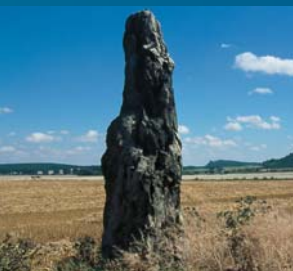
Een van de drie menhirs

Volgens de overlevering waren er ooit drie reuzen, die alle drie een boerenmeisje tot vrouw wilden nemen. Wie met haar mocht trouwen werd beslist door het werpen van een steen. Omdat de reuzen constateerden, dat de geworpen stenen verschillend groot waren, kon niemand de winnaar zijn. Zo gingen ze woedend uit elkaar. Terug bleven de verticale stenen. Tegenwoordig staan deze in de buurt van de B6. Twee ten noorden en een zuidelijk tussen Heimbürg en Silstedt. Het zijn de menhirs van Benzigerode. Bij de aanleg van de vierbaans rijksweg werden in 2001 archeologische onderzoeken gedaan. In de buurt kwamen talrijke artefacten van een nederzetting uit de jonge steentijd aan het daglicht. Daaronder een dodenhut, waarin tijdens de 'Bernburger cultuur' – rond 3400 tot 2800 v. Chr. – ca. 40 mensen werden bijgezet.