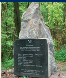
2007 opgericht monument

kluisenares hebben gewoond. Voor deze plaats wordt ook een Michaelskerk genoemd. Twee in de rotsen geslagen kruizen zijn in de rotswanden bewaard gebleven. Later bevond zich hier een kluisenarij van de legendarische Volkmarbroeders. In 1146 lieten zich hier de cisterciënzermonniken neer. De fundamenten boven de grot zijn vermoedelijk de resten van het eerste klooster Michaelstein, dat later dalafwaarts werd gebouwd (landmarkering 9). Een smalle kloof verbond het voormalige klooster met de grotkerk. Archeologische vondsten bewijzen, dat al in deze tijd bij de 'Eggeröder Brunnen' ijzererts in zogenaamde laagovens werd gesmolten. Ook in de 19 de eeuw werd op het 'Klostergrund' nog mijnbouw bedreven. Op 16 maart 1893 kwamen op de ijzererts-groeve Volkmar bij een dynamietexplosie acht mijnwerkers om het leven. Deze worden herdacht met een gedenksteen op het Klostergrund.