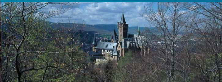
Uitzicht op het kasteel vanaf de Agnesberg

Oöliet is een oolitische kalksteen, die uit minuscuul kleine korreltjes bestaat. Oöliet is samen met roodachtig zandsteen van het Bundsandstein het meest gebruik-