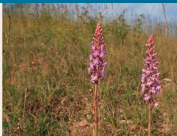
De grote muggenorchis Gymnadenia conopsea

van Benzigerode, op een rond 286 meter hoge kalk- steenrug van de Stuvenberg (305,7 m boven NN). De beklimming is mogelijk. Het verloop van de wallen, twee naast elkaar liggende rechthoekige burchtcom- plexen is nog zichtbaar.