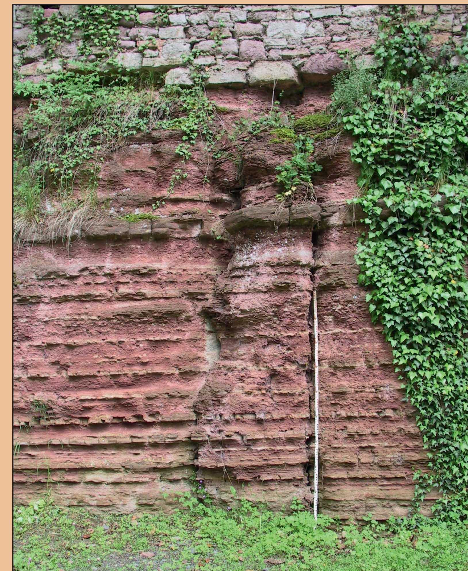
Aufschluss im Schlossgraben

Der Begriff „Rotliegend“ wurde im Mansfelder Land geprägt und ist ein alter bergmännischer Ausdruck. Mit ihm bezeichnete der Bergmann das unter dem nutzbaren Kupferschiefer lagernde Gestein. Da dieses taube Gestein im Liegenden des Kupferschiefers zu finden war, wurde es ursprünglich als „rotes totes Liegendes“ bezeichnet.