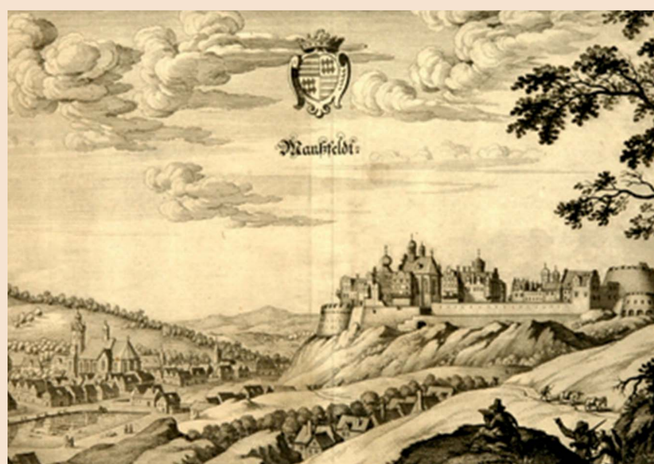
Schloss Mansfeld (Kupferstich aus dem Jahr 1650)