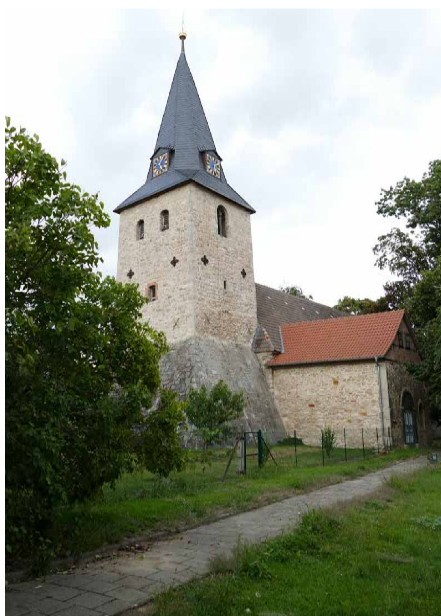
Kirche St. Marien mit von mächtigen Strebpfellern gestütztem romanischem Turm; das Kirchenschiff zeigt gotische Formen. Church of St. Mary with its Romanesque tower supported by massive buttresses; the nave is Gothic.

Während der Weichsel-Kaltzeit (115.000 bis 9.700 v. Chr.) waren die früheiszeitlichen Ablagerungen von einer Lößschicht überdeckt worden, die oberflächlich meist in fruchtbare Schwarzerde umgewandelt ist. Sie ist der Grund, warum große, wohlhabende Bauerndörfer entstehen konnten. Dedeleben, im Jahr 1114 als Dedeleben erwähnt, ist eines der ältesten. Darauf deutet die Endung -leben im Ortsnamen. Die älteste Stadt in Sachsen-Anhalt ist Aschersleben mit der Ersterwähnung als Ascegereslebe im Jahr 748. Schauen wir aus der Vogelperspektive auf Dedeleben, was Dank Google jedermann leicht möglich ist, fällt auf, dass es scheinbar zwei Ortskerne gibt: Am Markt mit Marienkirche bzw. zwischen Steinberg und Kirchstraße. Und tatsächlich trennte der Marienbach einst Klein- (Nord-) Dedeleben und Groß- (Süd-) Dedeleben. Das erklärt auch die Existenz zweier Kirchen, von denen die einstmals zum Rittergut gehörige Kirche St. Johannes leider ruinös ist. 1909 wurden beide Dörfer zusammengeschlossen, am 17. Oktober 1928 schließlich auch Gutsbezirk und Landgemeinde vereinigt. Der Turm des Rittergutes, Bergfried einer früheren Wasserburg, wurde Ende 1959/Anfang der 1960er Jahre abgerissen (KREBS 2015). Überwiegend verwendetes Baumaterial historischer Gebäude in Dedeleben ist Muschelkalk. Vereinzelt lassen sich auch Sandstein und Rogenstein feststellen.