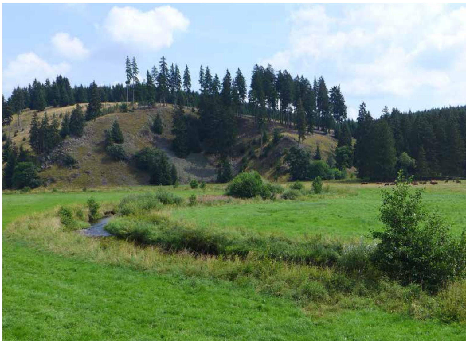
Grauwackeaufschluss rechts der Warmen Bode im Naturschutzgebiet Harzer Bachtäler Greywacke exposure near Warme Bode River in the Harzer Bachtäler nature reserve

Im Jahr 1886 war die Harzbahn (seit Übernahme durch die Deutsche Reichsbahn im Jahr 1950 „Rübelandbahn“) fertiggestellt worden. Sie verband im braunschweigischen Harz Blankenburg mit Tanne und brachte die ersten Gäste in den Ort. Der hier 1891 gegründete Harzklub-Zweigverein sorgte für den Ausbau des Wanderwegenetzes. 1899 erhielt Tanne dann auch Anschluss an die schmalspurige Südharzeisenbahn, die Walkenried mit Braunlage verband. Die Stichstrecke vom Bahnhof Brunnenbachsmühle zum Bahnhof Tanne wurde jedoch 1945 durch die Grenze zwischen der britischen und der sowjetischen Besatzungszone unterbrochen. In den Jahrzehnten danach befand sich in der östlichen Gemarkung Tanne ein Schießplatz der Grenztruppen der DDR. Inzwischen ist es hier ruhig geworden. Auf dem Kapitelsberg (528 m über NHN), einem Aussichtspunkt rechts der Warmen Bode, lädt eine Schutzhütte des Harzklub-Zweigvereins Tanne zur Rast ein. Weithin sichtbar ist der Kapitelsberg durch das mit Metall beschlagene Holzkreuz.