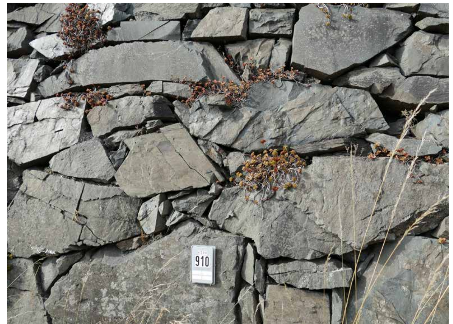
Tanner Grauwacke als frostbeständiges Baumaterial in einer Böschungsbefestigung Tanne greywacke used in slope-stabilisation due to its frost-resistant properties

Auch wenn Tanne ein Ortsteil der seit 2010 bestehenden Stadt Oberharz am Brocken ist, befinden wir uns geologisch gesehen doch im Mittelharz. Die südliche Begrenzung der Tanner Zone markiert den Übergang zum Unterharz. Typisch für die drei bis vier Kilometer breite Muldenzone ist die Wechsellagerung von Grauwacke und Grauwackeschiefern. Sie entstanden aus Ablagerungen, die während der Zeit des Unteren Karbons vor mehr als 330 Mio. Jahren untermeerisch erfolgten. Die Tanner Zone verläuft durch den gesamten Harz in nordöstlicher Richtung von Bad Lauterberg über Tanne bis zum Harzrand. Im Harzvorland wird sie von mächtigen Schichten des Erdmittelalters überdeckt; erst im anhaltischen Zerbst tritt sie wieder in Erscheinung. Harzer Bergleute gaben dem grauen bis graugrünen Sandstein bereits im 18. Jh. den Namen Grauwacke . Wir kennen den Begriff aus der Klage des Wolfes im Märchen „Der Wolf und die sieben jungen Geißlein“: „ Was rumpelt und pumpelt in meinem Bauch herum? Ich meinte es wären sechs Geislein, so sind's lauter Wackerstein. “